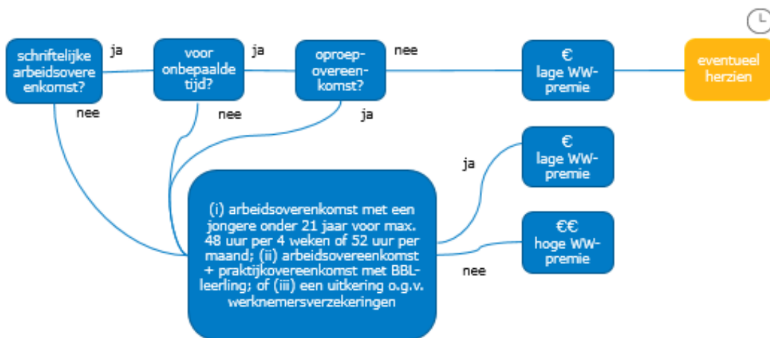
Figuur 1: hoge/lage WW-premie